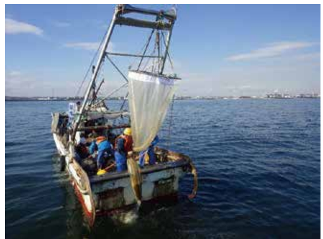
海生動植物調査: マルチネットによる卵稚仔調査