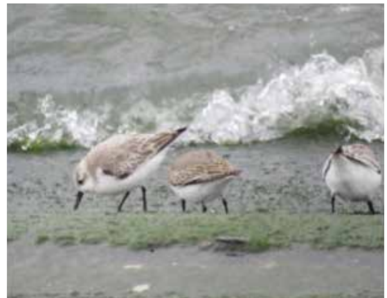
陸生動植物(重要種): ミユビシギ (愛知県RDB記載種: 越冬準絶滅危惧種)