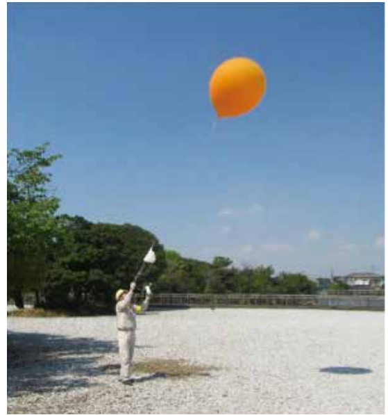
大気環境(大気質)調査: バルーンによる気象観測