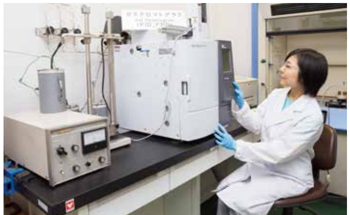
ガスクロマトグラフ