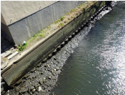
クリンカアッシュ覆土前