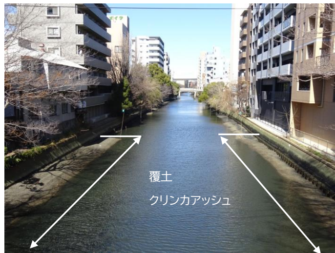
クリンカアッシュ施工後の状況