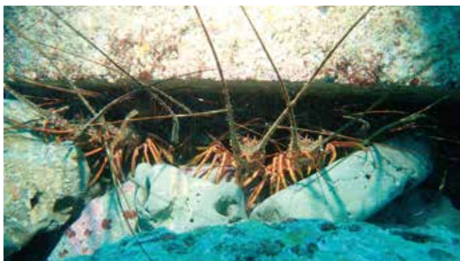
造成藻場に集まるイセエビ