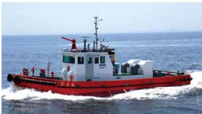
当社所有防災船「たける」(19t)

洋上風力発電事業においても、発電所建設に伴う航行安全対策の検討、工事中の安全管理、発電設備運用開始後に必要となるアクセス船（Crew Transfer Vessel=CTV）の検討・運航管理を通じて海の安全面から洋上風力発電事業を支えます。