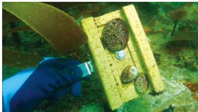
造成藻場への育成アワビ放流