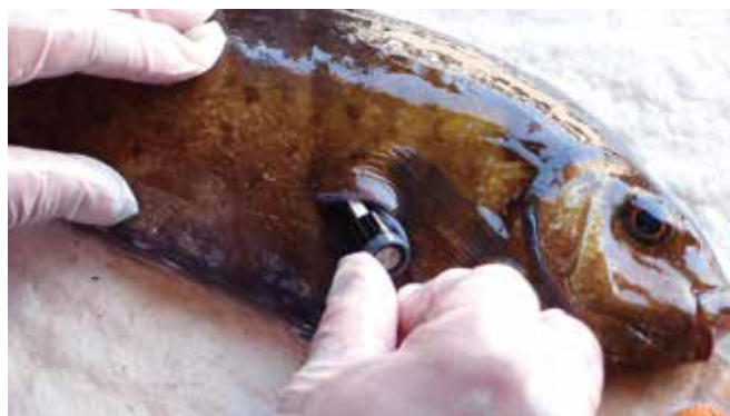
バイオテレメトリー調査（魚への発信機装着）