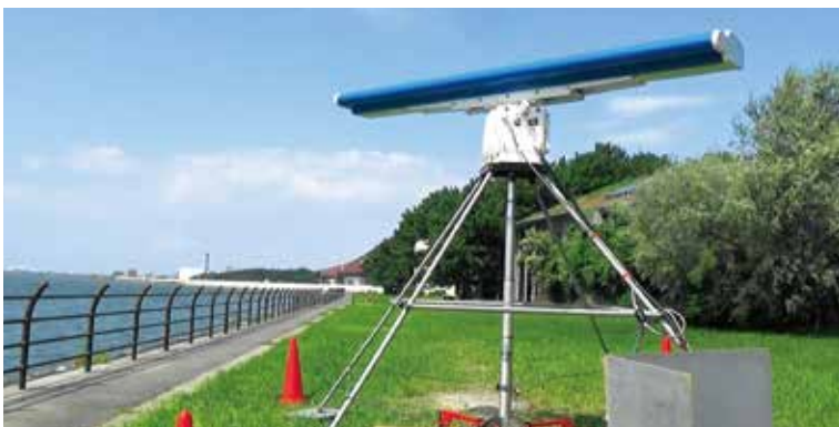
レーダーによる鳥類・コウモリ類調査

水平観測用・鉛直観測用レーダーやレーザー測遠システムを使用した鳥類・コウモリ類調査、水中音響調査装置を用いた超音波による海棲哺乳類調査、バットディテクターによるコウモリ類調査、動画やVRを活用したわかりやすい景観モニタージュの作成など、最新の調査・予測技術を導入して、客観的かつ高度なデータに基づく環境アセスメントを効率的かつ円滑に進めます。