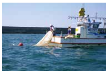
海洋生物調査(卵・稚仔魚調査)