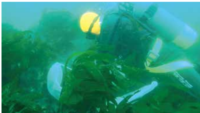
造成藻場の生育状況調査

洋上風力発電事業においても、風車の基礎などを利用した藻場造成、超音波バイオテレメトリー（バイオリギング）による魚類等の行動把握など、これまでの経験・技術を活かし、地域の漁業や海域環境と洋上風力発電所の共生に貢献します。