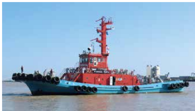
当社所有曳船「かすが」(196t)