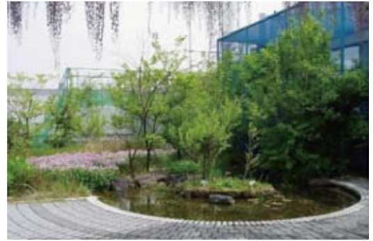
テクノ中部本店の屋上ビオトープ

■ ここで大切なことは、その小さな生き物がくらす場所を、子どもたちをはじめとする地域の人々やそこで働く人たちが、生き物とふれあい、四季を感じながら「地域の生き物のための環境づくりに積極的に関わる空間」としていくことです。